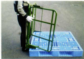
側面の片側を取り付けます。