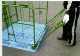
背面の格子を取り付けます。