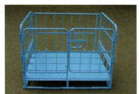
正面の観音扉を閉めて完成です。