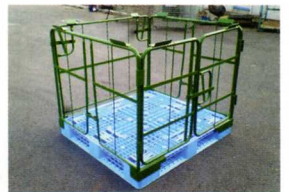
正面の観音扉を閉めて完成です。