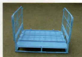
同様に片側の側面を取り付けます。