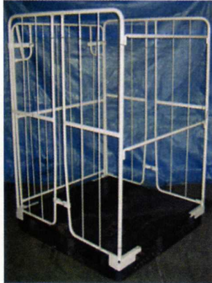
正面サイドバー仕様

パレットに装着し、使用するタイプの製品です。 使用しない時は、バラ積み保管が可能です。