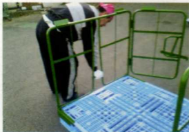
同様に片側の側面を取り付けます。