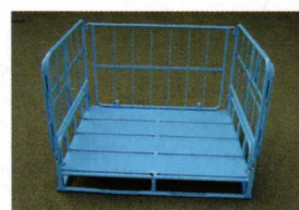
背面を側面に取り付けます。