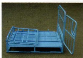
側面の片側を組み立てます。