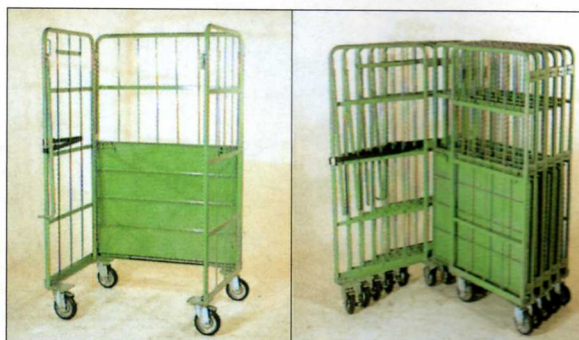
折りたたみ収納時